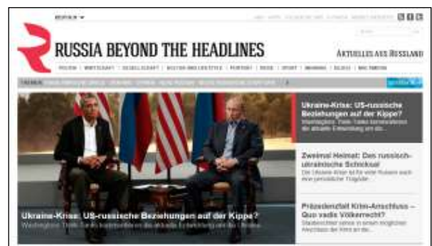
Foto: Der Online-Ableger von "Russland heute". Zum vollständigen Artikel auf der Homepage